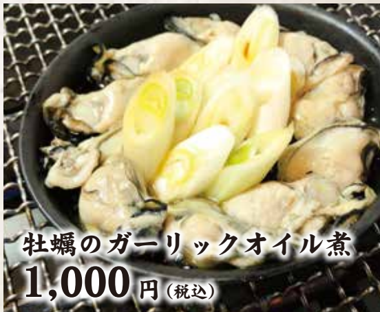
牡蠣のガーリックオイル煮 1,000円(税込)