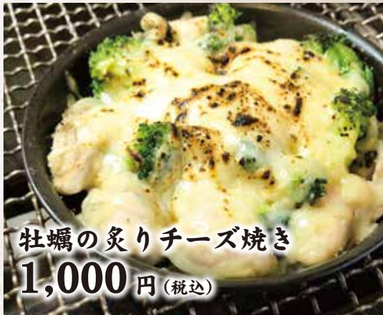
牡蠣の炙りチーズ焼き 1,000円(税込)